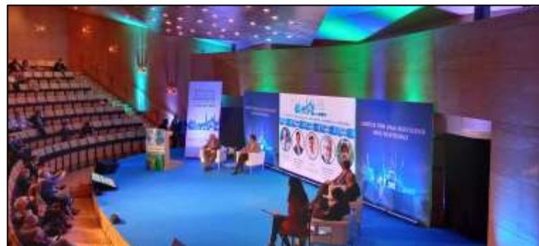
"VI. y VII. Encuentro Ciudades por la Seguridad Vial". Zaragoza, 2021.