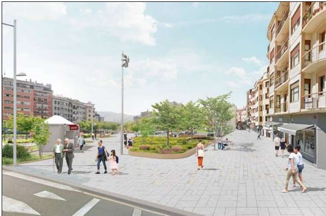
Plaza Jenaro Etxeandia, Irun