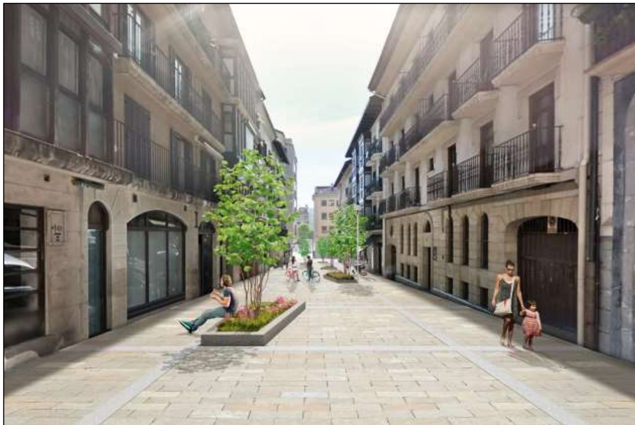
Calle Legia, Irun