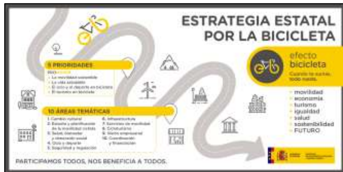
Plan Estratégico Estatal de la Bicicleta (PEEB) del MITMA