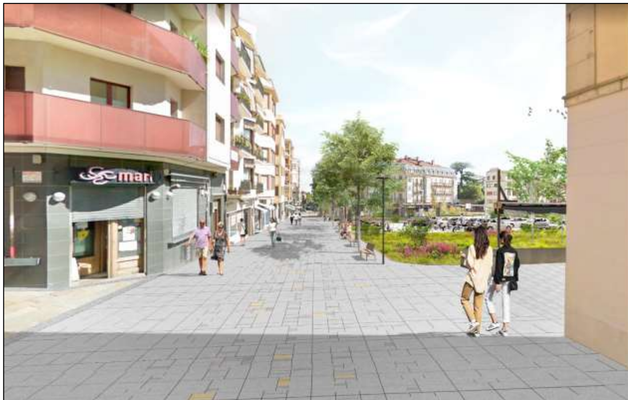
Calle Fueros, Irun