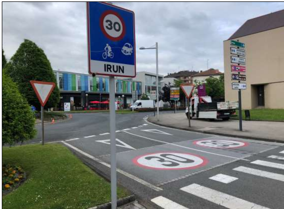
Osinbiribil, Irun 2023.