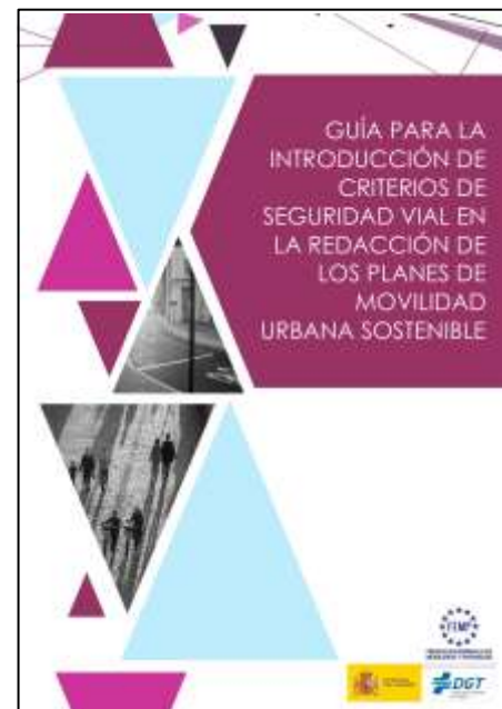
Guía DGT/FEMP para la introducción de criterios de seguridad vial en la redacción de los Planes de Movilidad Urbana Sostenible