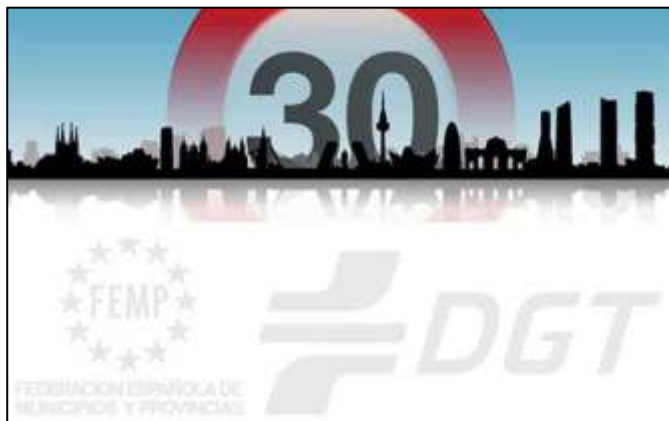
Guía DGT-FEMP Ciudad a 30 Km/h