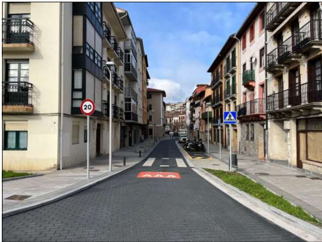
Calle Santa Elena, Irún 2023